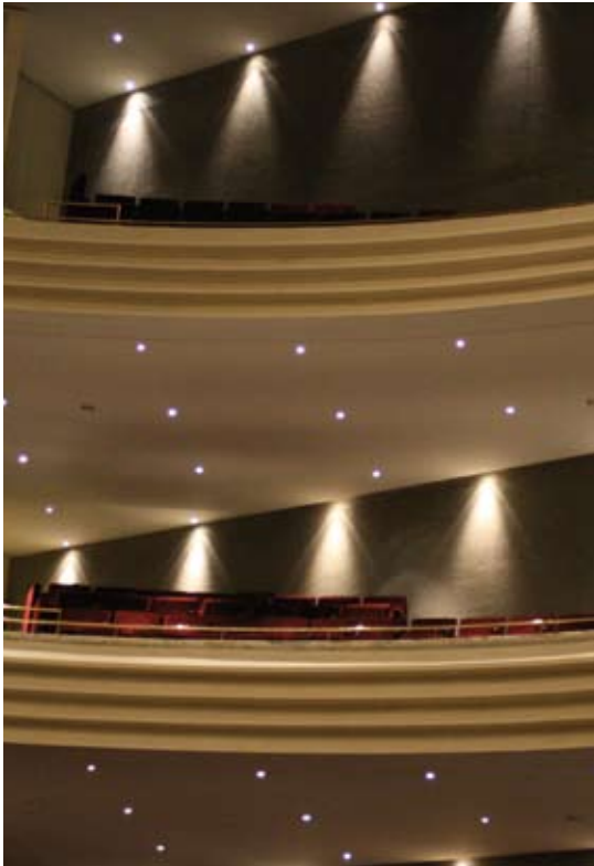
Nantes, 2 février 2007