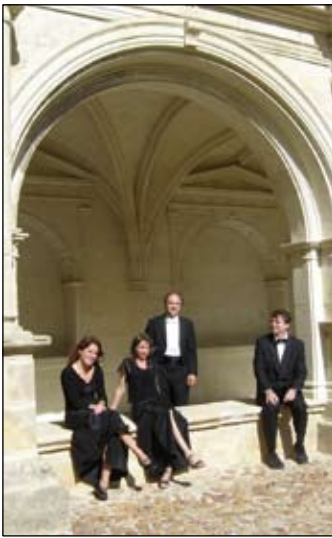
Fontevraud, 1 er octobre 2006