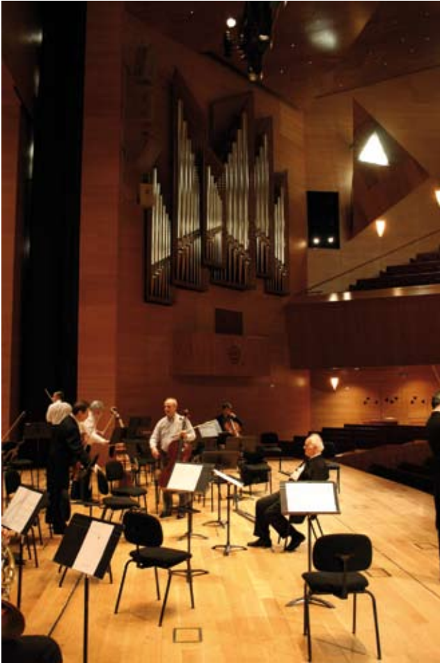
Bilbao, 4 mars 2007