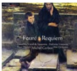
« Choc » du Monde de la Musique, avril 2007

On trouvera une discographie complète de l'EVL dans les pages qui suivent; des rééditions de ces classiques paraissent régulièrement. Pour les enregistrements de Michel Corboz à la tête d'autres ensembles, tels que le chœur de la Fondation Gulbenkian de Lisbonne, on se reportera aux listes données par les ouvrages consacrés à Michel Corboz ( Michel Corboz, l'alchimie des voix , La Bibliothèque des Arts, 2001, p. 123-136, et Michel Corboz ou la passion de la musique , L'Aire Musicale, 1981, p. 135-138).